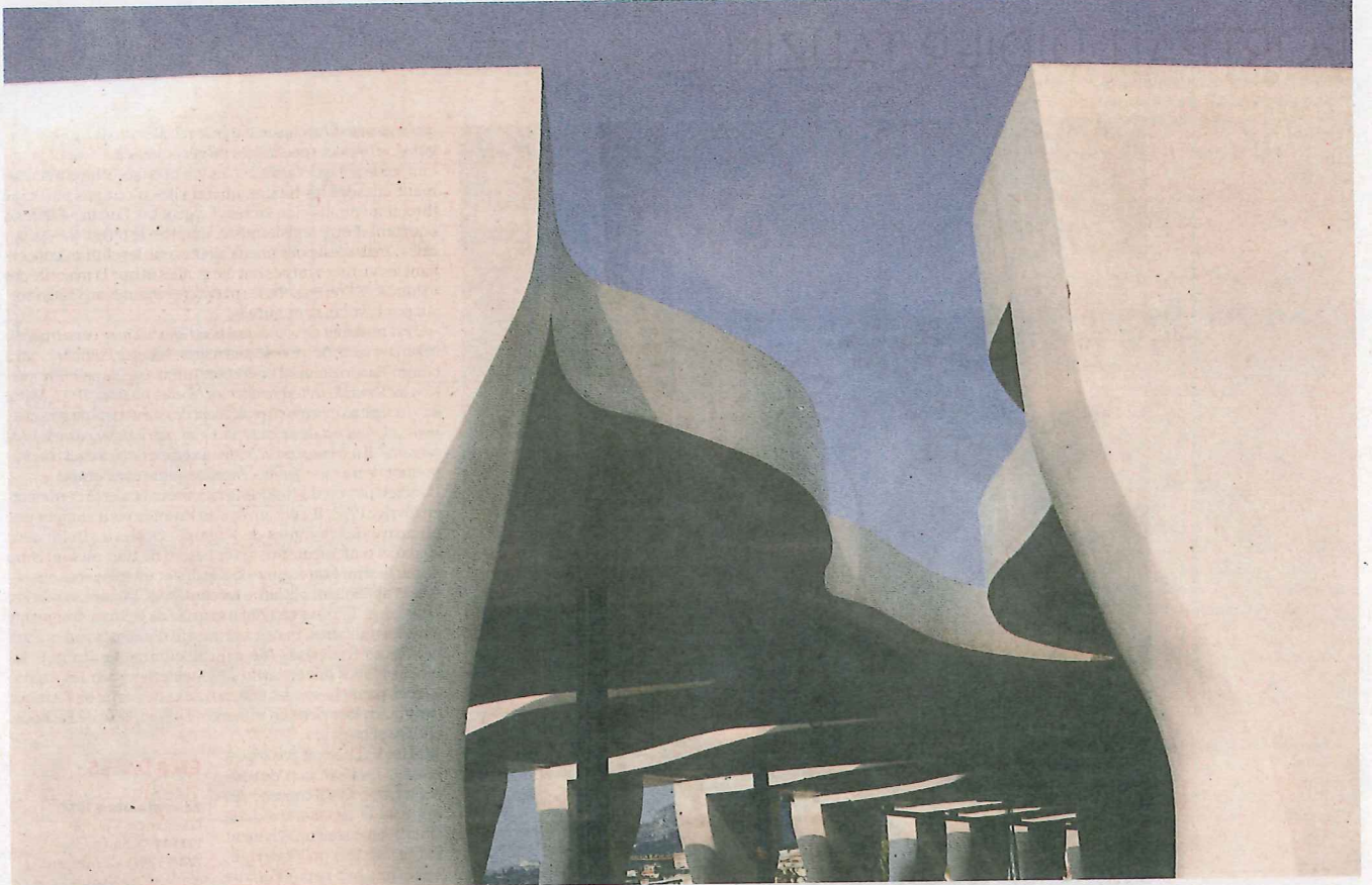
Le musée Jean-Cocteau, à Menton, qui ouvrira en novembre.