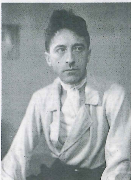
Jean Cocteau, en 1936.

Un imbroglio juridique où l'on croise, sur fond d'œuvres douteuses, le mécène Pierre Bergé, une experte en art et un milliardaire américain. C'est la collection de ce fan de Cocteau, bientôt exposée à Menton, qui sème la discorde.